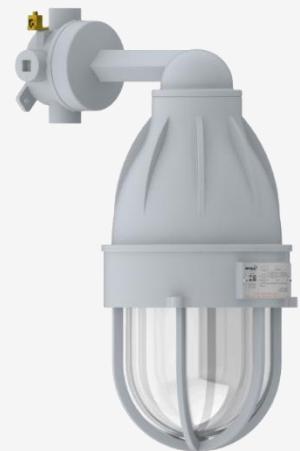
EW17/2 | EW17/3