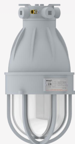
EW15/2 | EW15/3