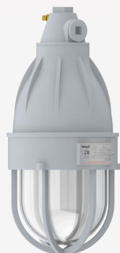
EW10/2 | EW10/3